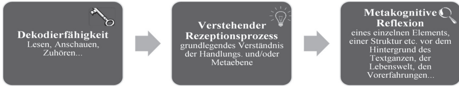
Abbildung 1: Voraussetzungen des bewussten Rezeptionsprozesses zur Analyse fiktionsanzeigender Strukturen

Bevor die eigentliche Untersuchung der Fiktionalität des Gegenstandes erfolgen kann, muss dieser zunächst in Abhängigkeit zur jeweiligen Mediumsform dekodiert werden. Die Dekodierfähigkeit der Kinder hängt jedoch stark von ihren bereits erworbenen Fertigkeiten und Erfahrungen ab, sodass dieser Schritt erst – weitestgehend – problemlos von Statten gehen kann, wenn der kindliche Rezipient gelernt hat, Texte zu lesen, Filme und Bilder aufmerksam zu betrachten oder Hörmedien aktiv zuzuhören. Kindern, die noch nicht über diese Dekodierfähigkeiten verfügen, bleibt folglich der Zugang zu fiktionalen Gestaltungsstrukturen verwehrt.