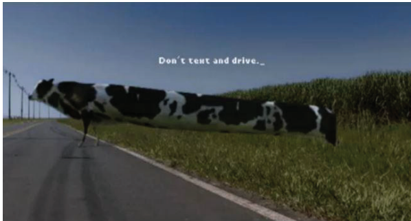
Abbildung 3: In dieser Fiat-Werbung verlängert sich der Körper einer Kuh in der Zeit, die ein Fahrer mit dem Schreiben einer SMS verbringt.

Abbildung 2 zeigt ein „logisches Bild“ (Schnotz 2002: 65). Hier wird das Alter der Probanden eines Tests räumlich auf der Zeitachse x abgetragen. Ihr „Weisheits-Niveau“ schlägt sich räumlich auf der y-Achse nieder. Für den Rezipienten gilt es zu verstehen, dass die Quantitäten von Zeit und Weisheit als Raum dargestellt sind. Für