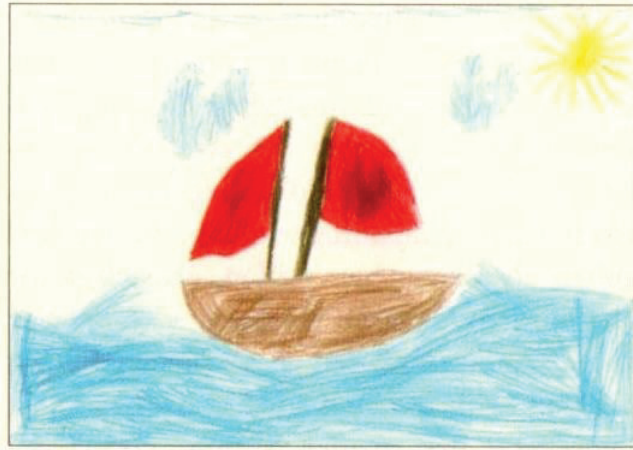
Abbildung 1: Gemälde eines Schülers zu Meyers „Zwei Segel“. Mit der Übertragung ins Bild-Medium dokumentiert der Schüler sein Textverständnis (vgl. Pompe 2013: 50).

dung 1), aus denen Schlüsse zu ihren Verstehensleistungen gezogen werden (vgl. ibid. : 50). Metaphern, so muss Pompe annehmen, können in unterschiedlichen Zeichensystemen realisiert werden und sind übersetzbar.